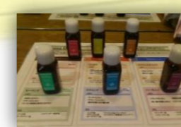
日々のクリームバス 今日の香りはこれ!!

オーナーより一言 今話題のセラセンタ商品も取り扱っています。薄毛?白髪?は頭皮が問題かも... スタイルだけでなく頭皮の相談もお気軽に!!